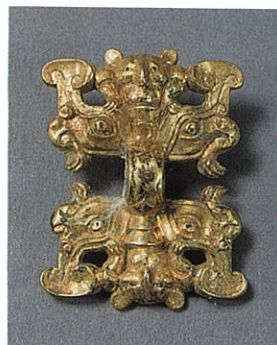
○門に取り付けた魔除けの飾り【金鋪首】(戦国時代)