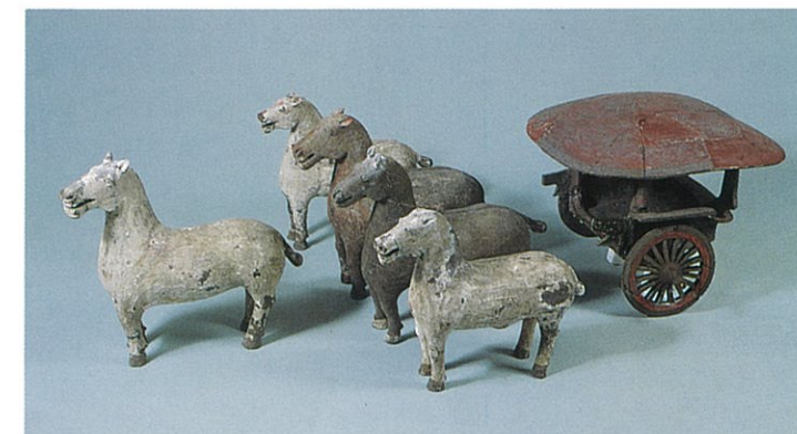
○墓に納めた馬車の模型【陶馬車】(前漢)