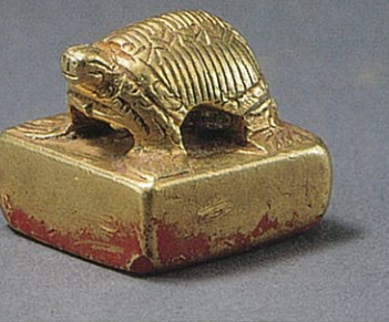
○鈕が亀の形をした金印【関内侯金印】(前漢)