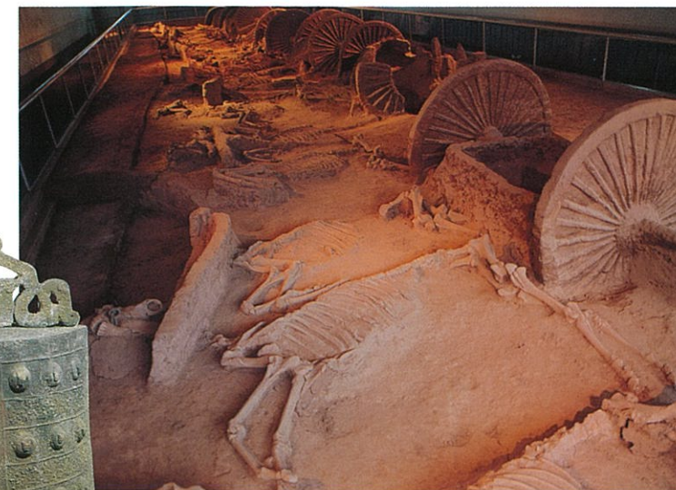
○墓の周囲に埋めた馬車【車馬坑】(春秋時代)