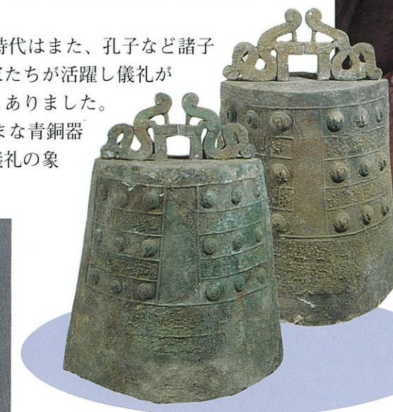
○打ち鳴らす鐘【銅編鐘】(春秋時代)