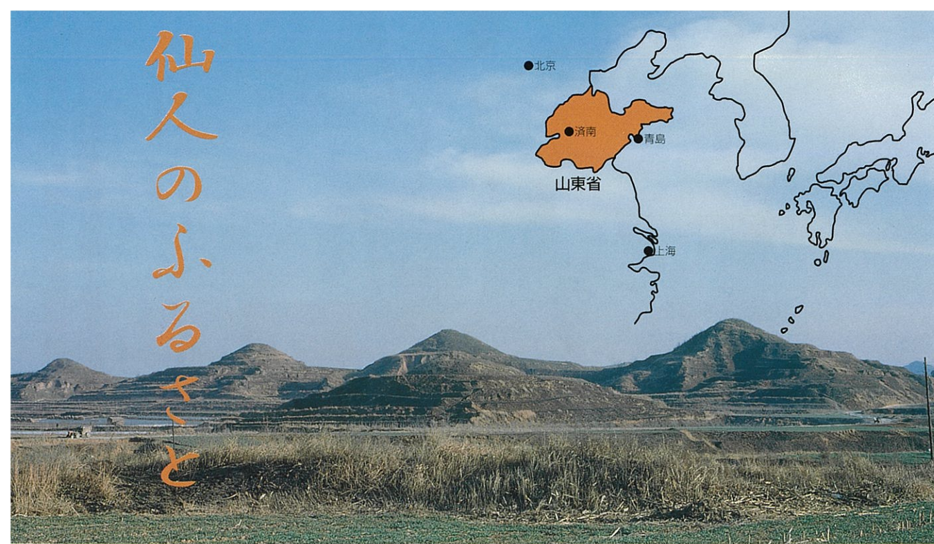
○戦国時代の齊王が葬られた四王塚