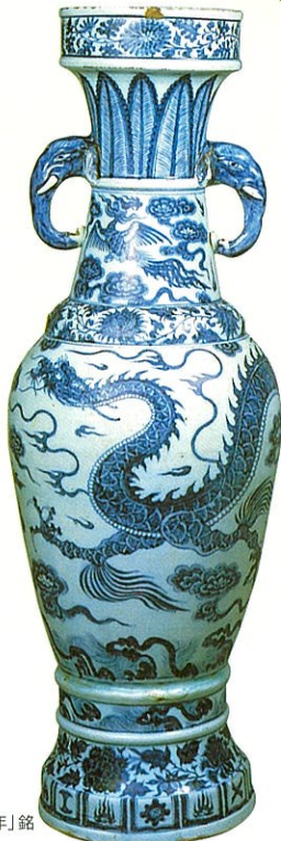
青花 雲龍文 双耳瓶「至正十一年」銘 景德鎮窯 元時代 1351年