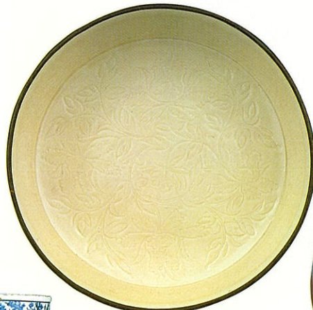
白磁刻花 牡丹唐草文 洗 定窯 北宋時代 11~12世紀