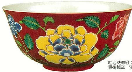
紅地琺瑯彩 牡丹文 碗「雍正御製」銘 景德鎮窯 清時代・雍正(1723~35)

本展では端整で気品ある北宋時代の汝窯青磁、明時代の景德鎮官窯で焼かれた華やかな色絵や青花、最高の窯業技術を駆使した清時代の琺瑯彩など、各時代を代表する中国陶磁の至宝80点を紹介いたします。