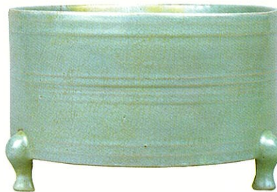
青磁 三足香炉 汝窯 北宋時代 11~12世紀