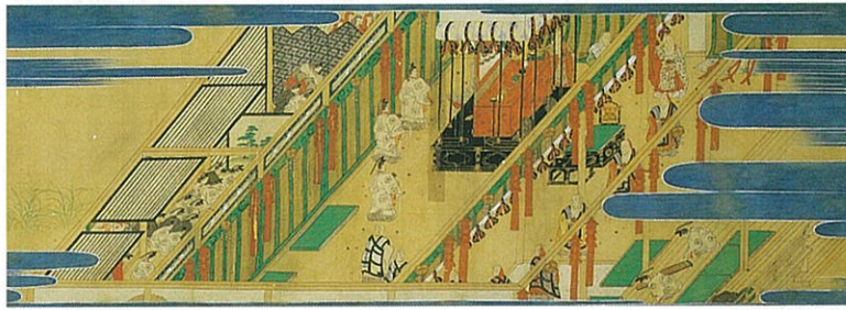
宮中御儀法講繪巻

本展は重要文化財「三千院円融藏典籍文書類3021点」をはじめ、三千院に伝わる多くの文化財の修理が完成したのを記念して開催するものです。歴史上はじめて門外に出る往生極楽院の観音菩薩像・勢至菩薩像を筆頭に、このたびの修理で発見された下村観山による障壁画など、国の重要文化財44点を含む約100件の名宝により三千院の歴史と文化を紹介します。