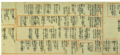
重要文化財 帝王系図