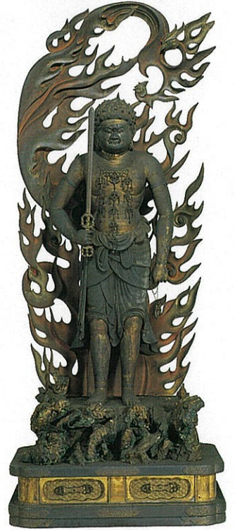
金色不動明王立像