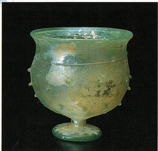
●突起装飾杯 シリア 4-5世紀 高(H)11.8cm 個人蔵