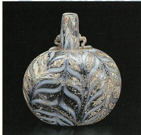
●練込装飾小瓶 シリア 12-13世紀 高(H)9.0cm 愛知県陶磁資料館(鈴木青々コレクション)