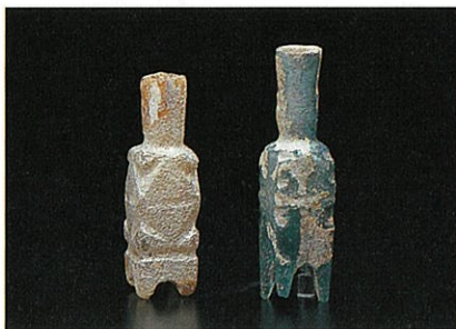
●切子小瓶 イラン 9-10世紀 左:高(H)6.6cm 右:高(H)7.5cm 愛知県陶磁資料館(鈴木青々コレクション)