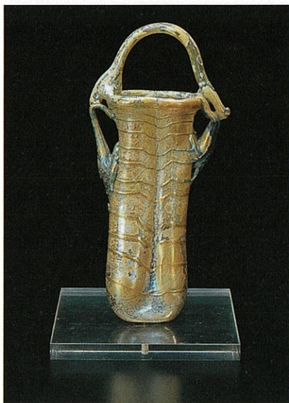
●吊手付二連瓶 シリアまたはイタリア 4-5世紀 長(L)15.0cm 個人蔵