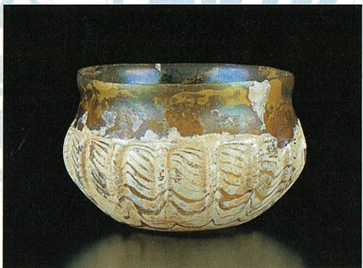
●練込装飾條文碗 シリア 1-2世紀 口径(D)8.3cm 個人蔵