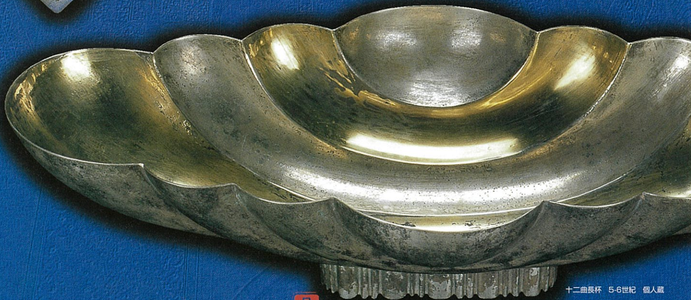
十二曲長杯 5-6世紀 個人蔵