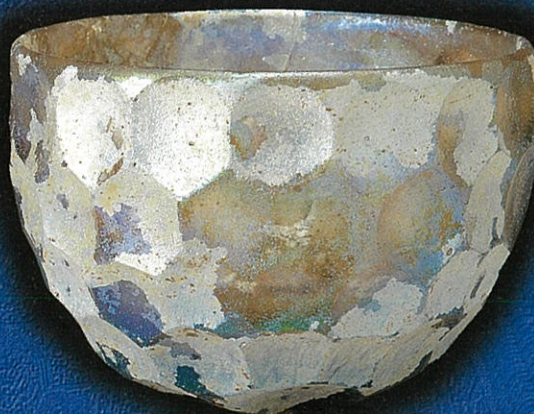
円形切子碗 6世紀 個人蔵