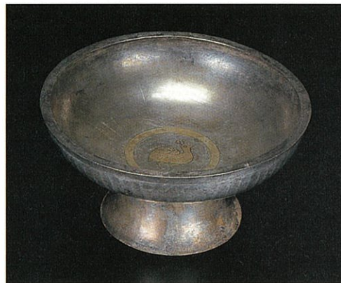
●鳥文台付杯 イラン 5-6世紀 口径(D)17.5cm 個人蔵