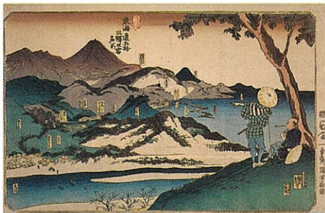
【後期】歌川国芳「東海道五拾三駅五宿名所 由井 興津 江尻 府中 鞠子」

風景画は浮世絵において美人画や役者絵とともに主要なテーマでありました。江戸時代の初期から名所風景が描かれ、西洋の遠近法を用いた浮世絵や陰影法を使って西洋風に表現した作品も制作されましたが、風景画がジャンルとして確立されたのは天保期(1830~1844)に入ってからでした。