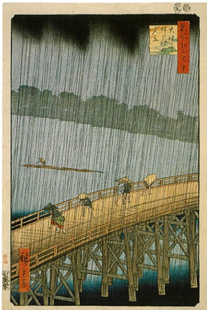
前期 歌川広重「名所江戸百景 大はしあたけの夕立」