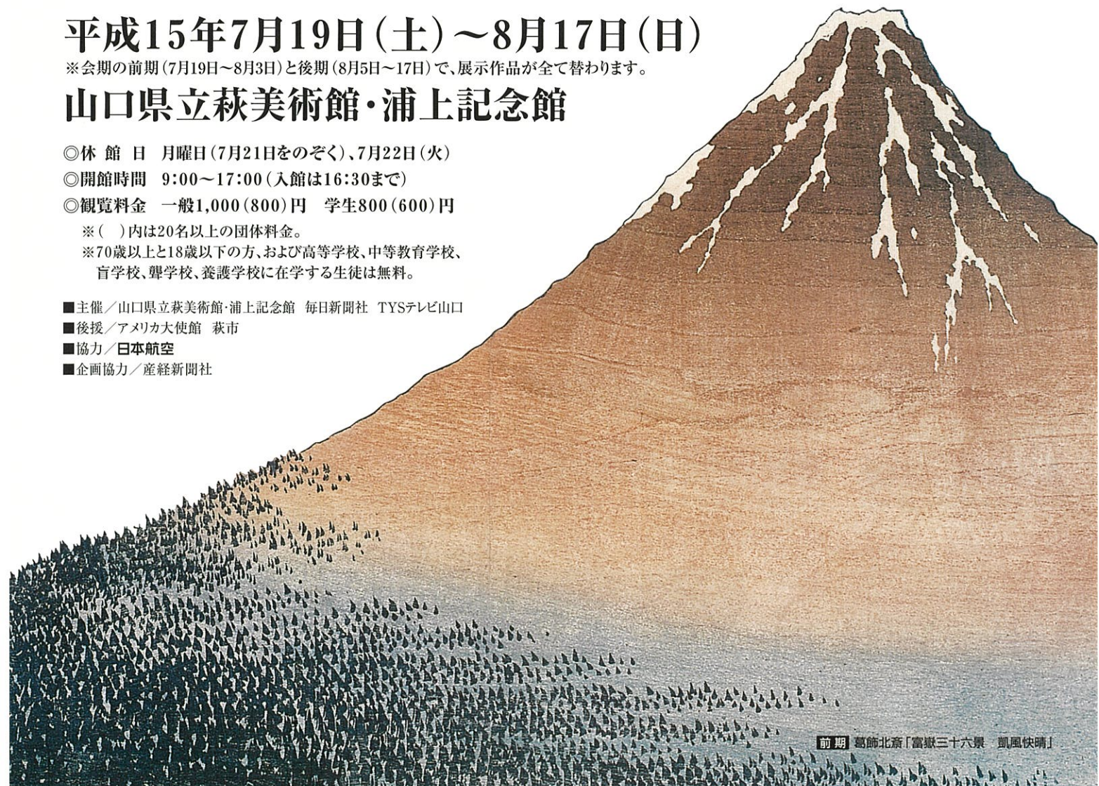
前期 葛飾北斎「富嶽三十六景 凱風快晴」