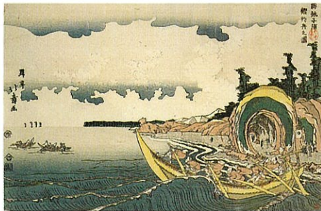
【前期】昇亭北寿「下総銚子浦鯉釣舟之図」