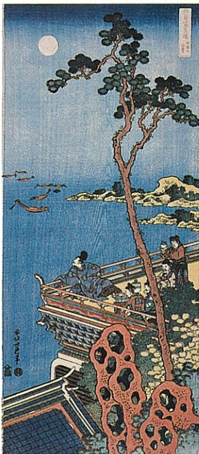
【前期】葛飾北斎「詩寫写真鏡 安倍の仲麻呂」