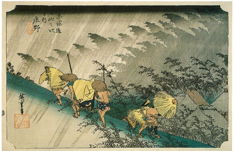
後期 歌川広重「東海道五拾三次之内 庄野 白雨」