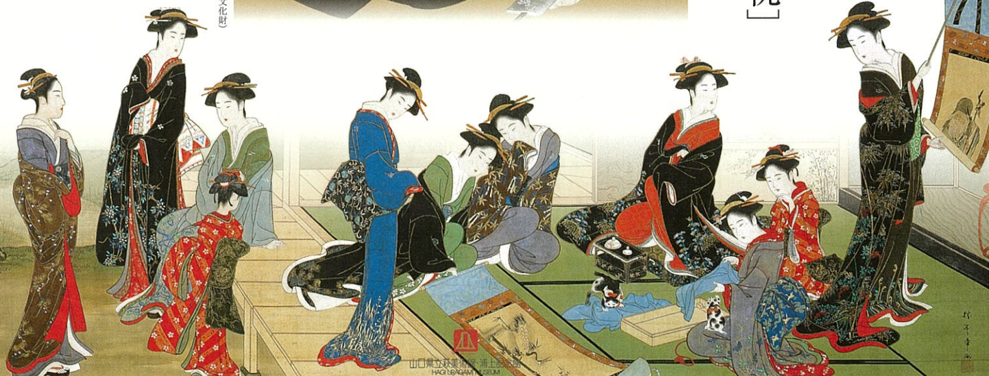
喜多川歌麿「大坂賣図」二福 絹本着色