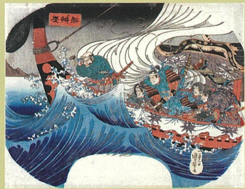
歌川国芳「船弁慶」 團扇絵判錦絵 天保13年(1842)頃