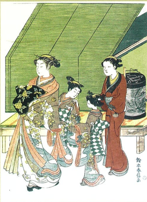
鈴木春信「伝 松坂屋野風」 中判錦絵 明治

MASTERPIECES OF UKIYO-E FROM THE VICTORIA AND ALBERT MUSEUM