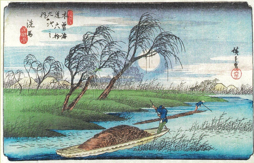
歌川広重「木曾海道六十九次之内 洗馬」 横大判錦絵 天保中・後期