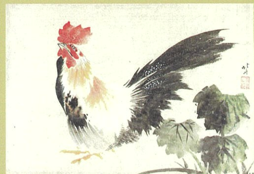
葛飾北斎「肉筆画」鶏」 折帖 文化5年~6年(1808~1809)頃