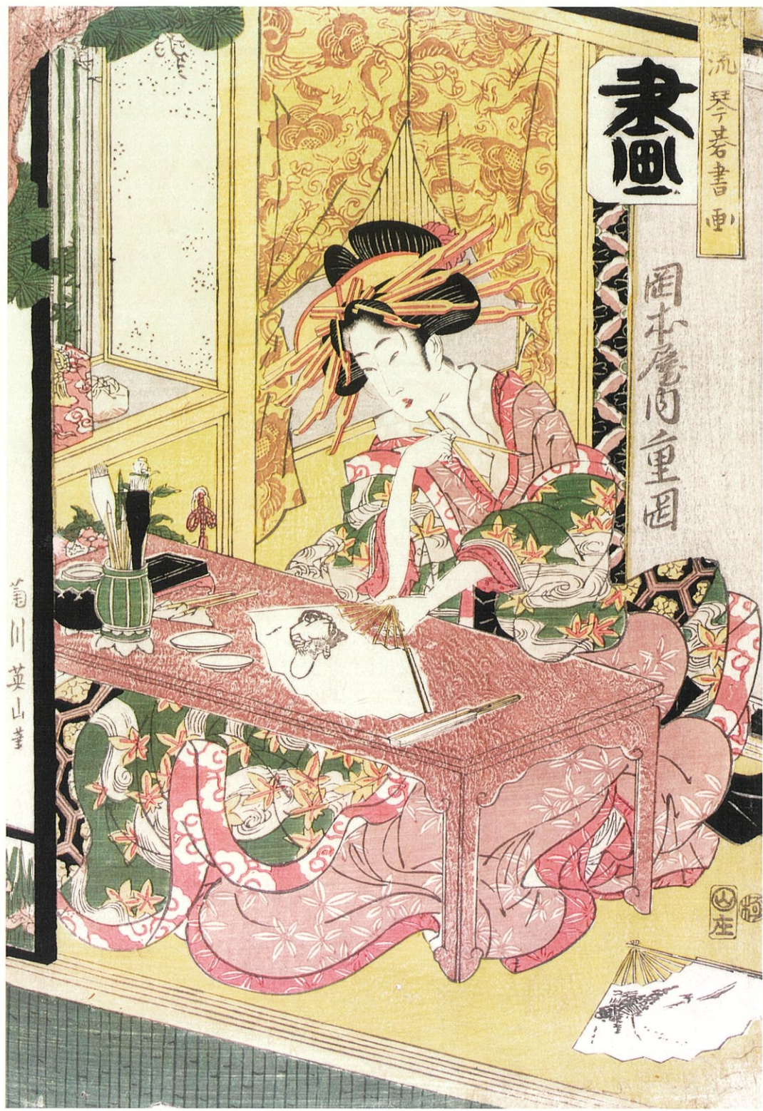
菊川英山「風流琴書画 画 岡本屋内重画」 大判錦絵 文化末期