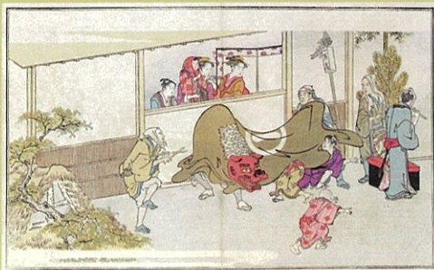
喜多川歌麿「狂歌絵本」 狂歌絵本 天明8年(1788)