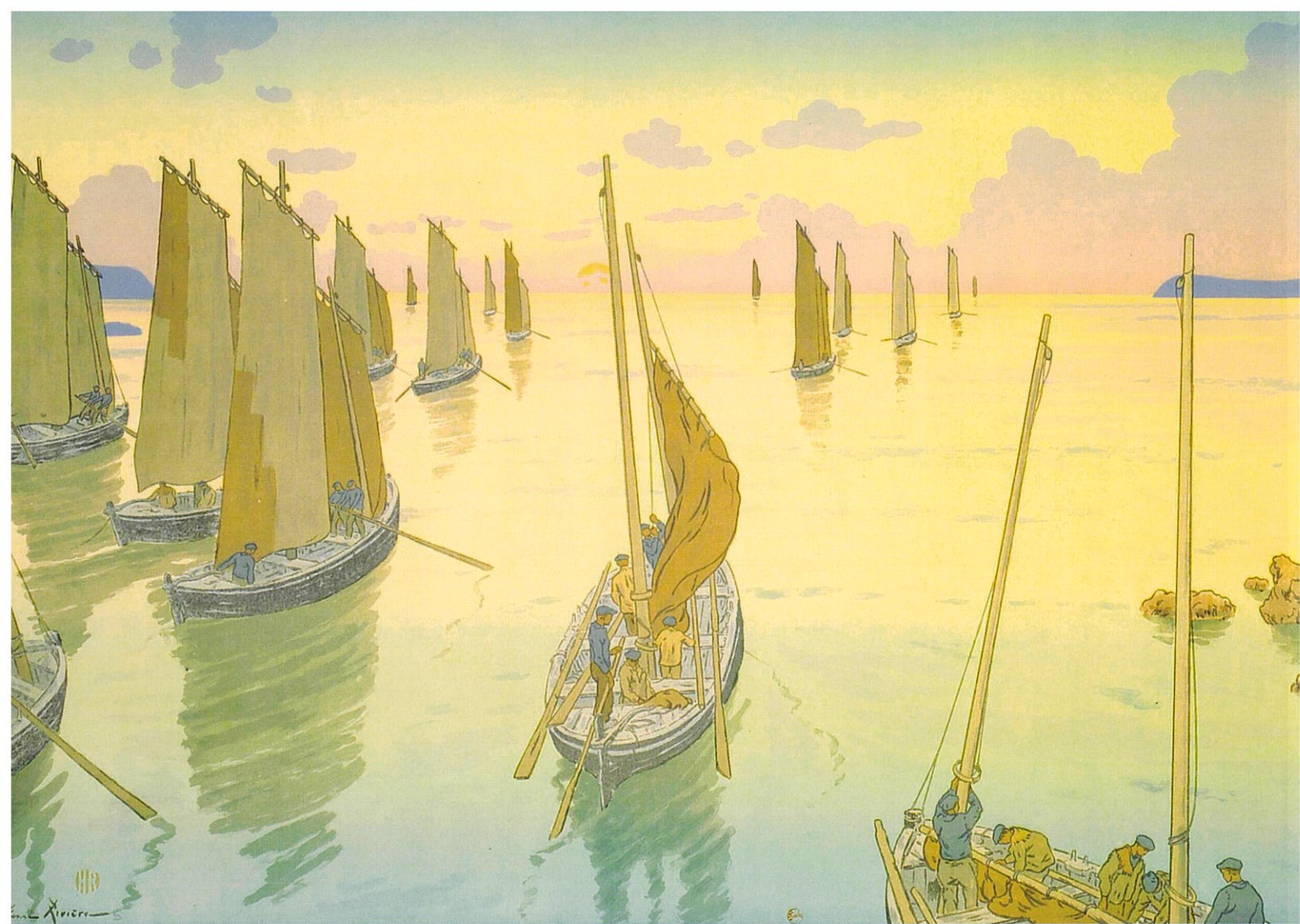
「自然の様相 日没」 リトグラフ フランス国立図書館蔵 ©ADAGP, Paris & SPDA, Tokyo, 2009 Photo Bibliothèque nationale de France