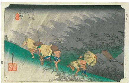
歌川広重「東海道五十三次之内 庄野 白雨」横大判錦絵 天保4~5年【前期】