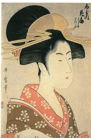
喜多川歌麿「雨屋内花扇 よしの たつた」 大判錦絵 寛政8年【前期】