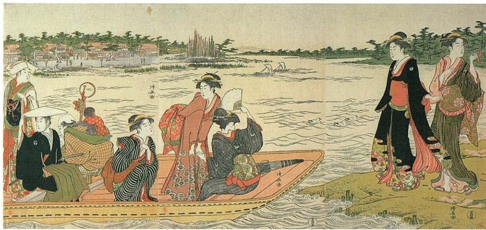
鳥居清長「隅田川渡し船」 大判錦絵3枚続 天明7年【後期】