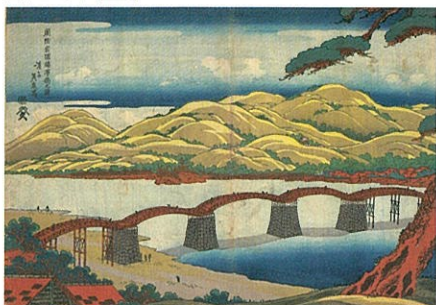
渓斎英泉「周防岩国錦帯橋之図」横大判錦絵 文政~天保期【後期】