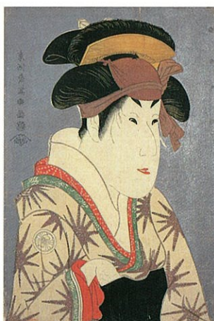
東洲斎写楽 「三代目瀬川菊之丞の田辺文蔵妻おしづ」 大判錦絵 寛政6年【後期】