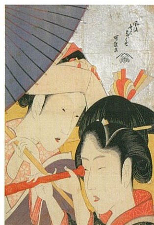
葛飾北斎「風流無くてなぐせ 遠眼鏡」 大判錦絵 享和期頃【前期】