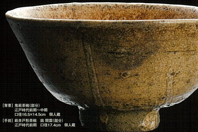
[背景] 鬼萩茶碗(部分) 江戸時代前期~中期 口径16.5x14.5cm 個人蔵 [手前] 萩井戸形茶碗 鉢 間雲(部分) 江戸時代前期 口径17.4cm 個人蔵

主催 / 古萩展実行委員会 (山口県立萩美術館・浦上記念館、朝日新聞社、yab山口朝日放送) 後援 / 山口県教育委員会、萩市、萩陶芸家協会、公益社団法人日本工芸会山口支部、公益社団法人日本工芸会西部支部 協力 / エフエム山口