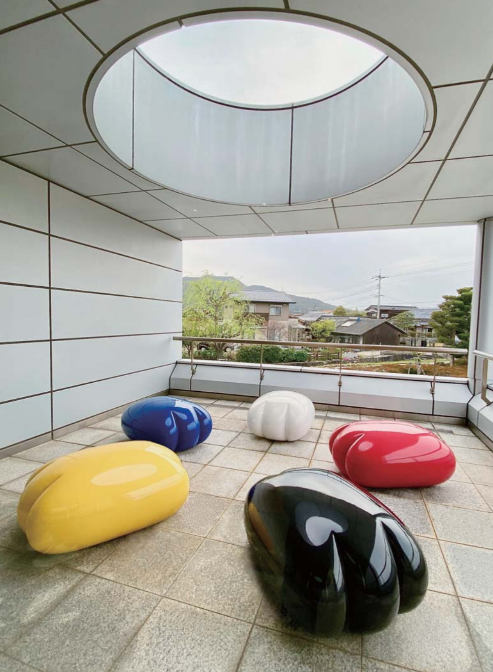
ふわふわ5！ 2011年（各w.1000-d.800-h.550mm）素材：FRP 茨城県陶芸美術館蔵