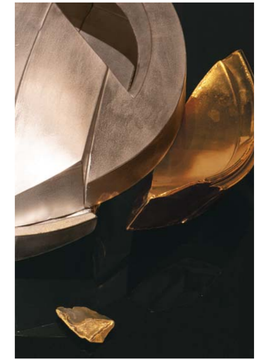
Energy Explosion (部分) 2020年 (w.800-d.800-h.130mm 台座を含む)