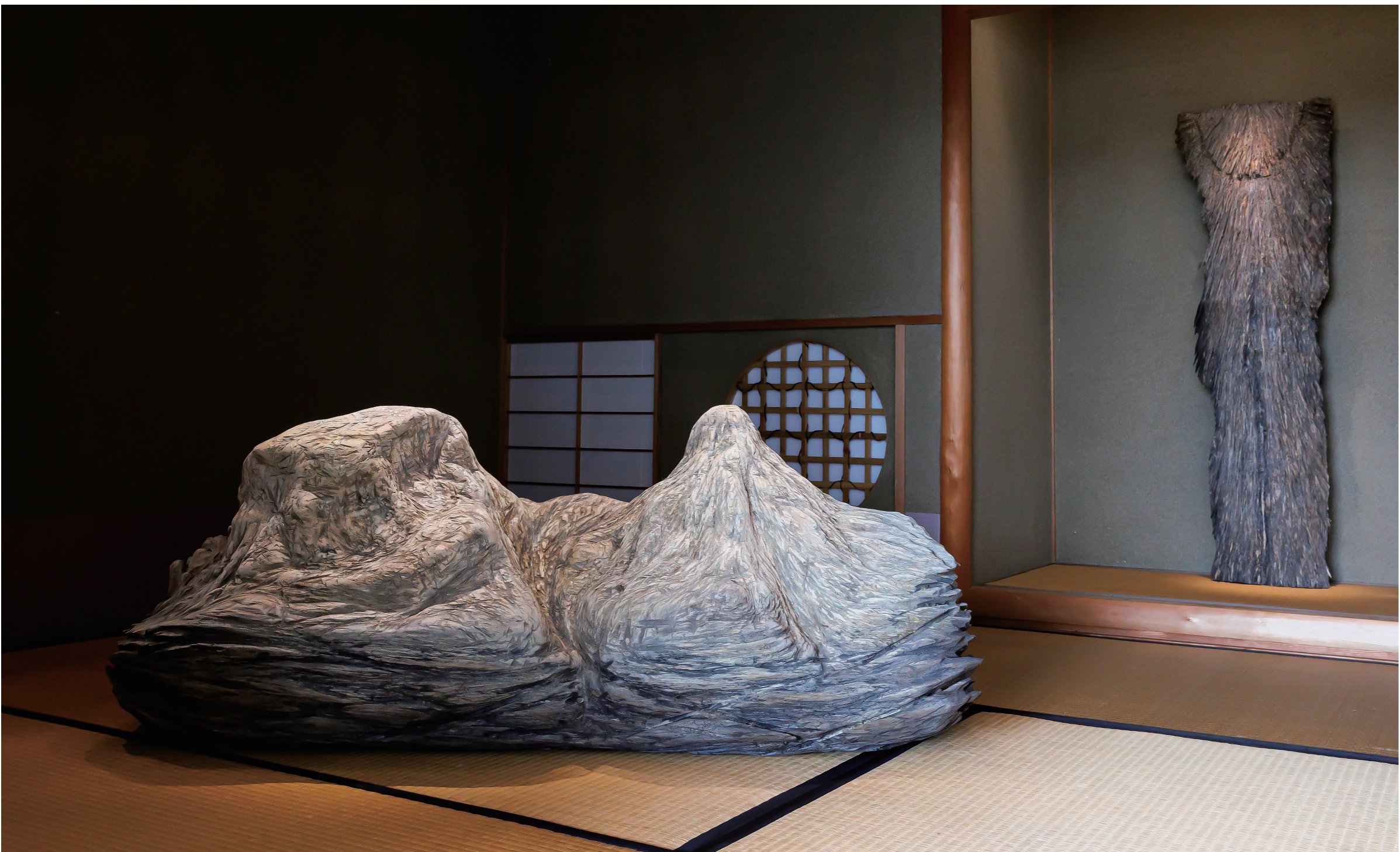
左) 《mantle I》2026年 h52×w137×d57cm 棉、雲母、アクリル絵の具、木炭 右) 《mantle II》2026年 h137×w45×d7cm 棉、雲母、アクリル絵の具、木炭