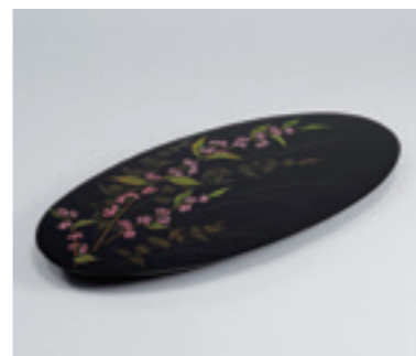
7.忖山美知子《蒔薺平皿「風式部」》 2008年