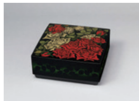
13.忖山美知子《蒔薺箱「香満つ」》 2015年