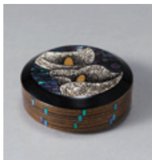
8.忖山美知子《蒔薺香合「夏色」》 2008年