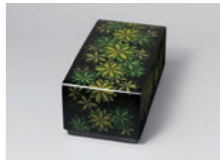
6.忖山美知子《蒔薺箱「馬酔木」》 2007年