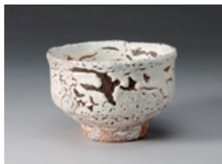
4.三輪壽雪 (十一代休雪)《鬼萩茶碗》 2000年