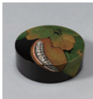
10.忖山美知子《蒔薺香合「山の果」》 2011年