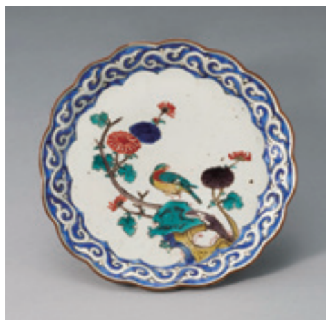
1.色絵花鳥文輪花皿 江戸時代 (17世紀前半)