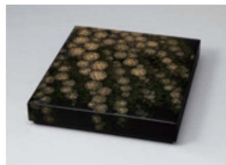
1.忖山美知子《蒔薺色紙箱「小手毬」》 1997年