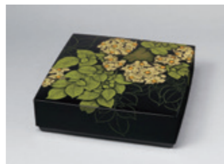
11.忖山美知子《蒔薺箱「土の香」》 2013年