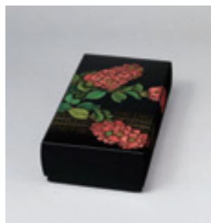
9.忖山美知子《蒔薺箱「百日紅」》 2009年