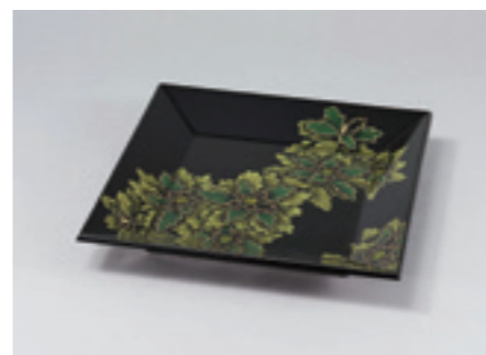
14.忖山美知子《蒔薺四方盆「秋隣」》 2015年