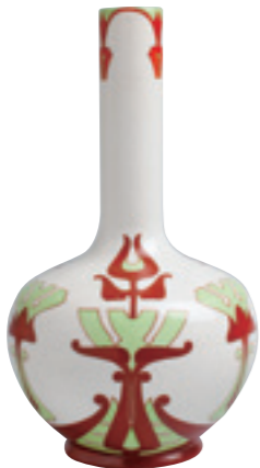
花瓶《カレヴァ》1906-1914年 アラビア製陶所 コレクション・カッコネン

フィンランドを代表するアラビア製陶所をはじめ、ゴールデンエイジと呼ばれる時代の著名な作家陣の陶芸作品が来日。キルタヤパラティッシなどのプロダクト作品に加え、これまで日本ではあまり紹介されてこなかった、アート(美術)部門の陶芸作品も展示します。