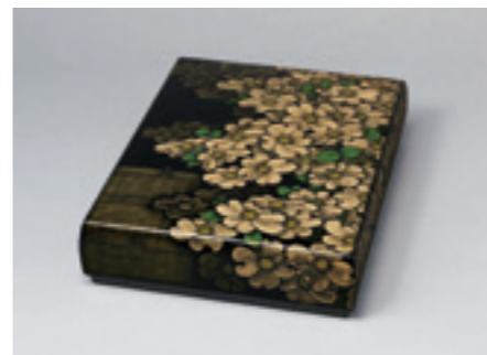
4.忖山美知子《蒔薺箱「垣根越し」》 2005年