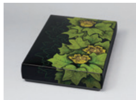
12.忖山美知子《蒔薺箱「半纏木」》 2014年