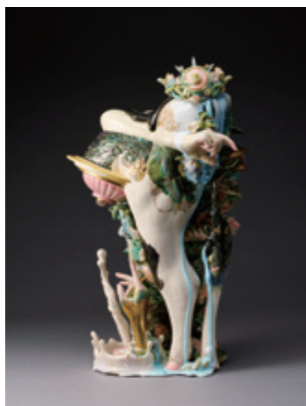
9.大石早矢香《サシクニワカヒメ -母性-》 2016年