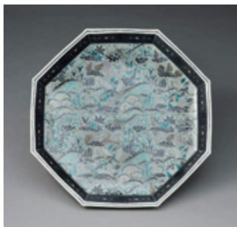
7.十四代今泉今右衛門《色絵薄墨墨はじき草花更紗文額皿》 2018年