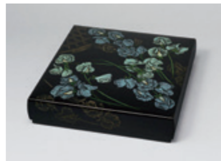
5.忖山美知子《蒔薺箱「淡彩花」》 2006年