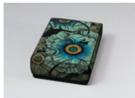
16.忖山美知子《蒔薺箱「花に舞う」》 2016年