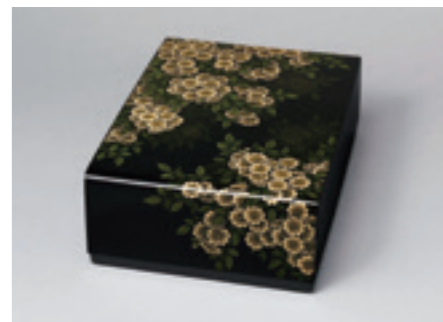
3.忖山美知子《蒔薺箱「木陰」》 2004年