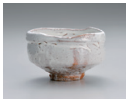
3.三輪休和 (十代休雪)《萩白釉茶盤》 1975年