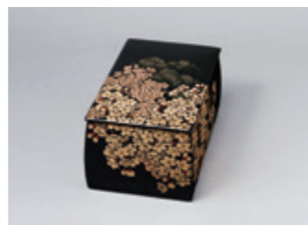
15.忖山美知子《蒔薺箱「さくら」》 2016年