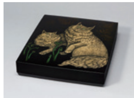
2.忖山美知子《蒔薺色紙箱「羽音」》 1999年