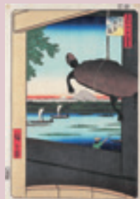
歌川広重 名所江戸百景 深川万年橋