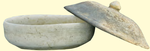
4 蓋杯 古墳/飛鳥時代(7世紀) 牛頭窯 福岡県大野城市牛頭月ノ浦1号窯跡出土 大野城市

また、8世紀になると火葬の広まりとともに葬法が変化し、遺骨を納める骨壺が須恵器で作られるようになりました。そのなかには、「蓋付双耳壺」(写真5)のようにどういった人物が葬られたかを示す墓誌(写真6)を伴うこともありました。この表には、「佐井寺僧□道薬師□族姓大柁君/素止奈之孫」(佐井寺の僧・道薬師、大柁君、素止奈の孫)、裏には、「和銅七年歳次甲寅二月廿六日命過」(和銅7年(714)2月26日に亡くなった)の文字が刻まれており、これがおおよそいつ頃に作られたものかを知る手掛かりにもなっています。こういった好例の助けもあり、6世紀から8世紀にかけて、須恵器は、仏教文化を受け入れ、次第にその形を変えていった様子が見えます。