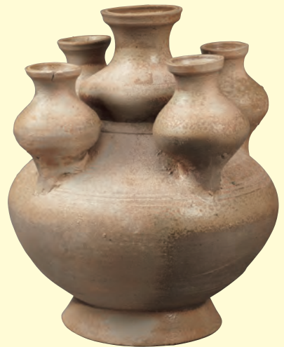
12 灰釉五管瓶 後漢時代(1~3世紀) 山口県立萩美術館・浦上記念館