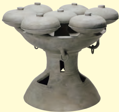
7 重要文化財 七連杯付裝飾器台 古墳/飛鳥時代(6世紀後半) 鳥取県倉吉市野口1号墳出土 倉吉市立倉吉博物館 [展示期間: 8月11日~9月23日]