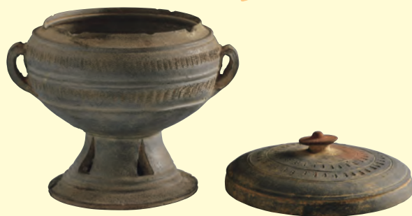
1 重要文化財 無蓋高杯 古墳時代(5世紀前半) 兵庫県姫路市宮山古墳出土 姫路市教育委員会 [展示期間: 8月11日~9月23日]