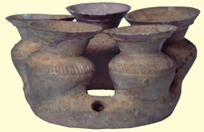
11 環台五連壺 古墳時代(5世紀) 島根県松江市金崎1号墳出土 京都大学総合博物館