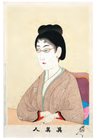
「真美人 女教師」明治31年（1898）

今回は江戸城大奥を描いた「千代田の大奥」、江戸から明治の風俗と美人画を取り合わせた「時代かがみ」、明治の新風俗を描く「真美人」など、代表的なシリーズを中心にご紹介します。