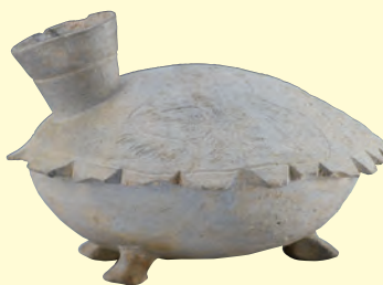
9 広島県指定重要文化財 亀形須恵器 古墳/飛鳥時代(7世紀前半) 広島県安芸高田市一ツ町古墳出土 個人蔵