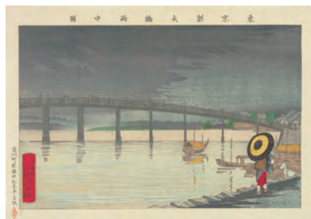
「東京新大橋雨申図」明治9年（1876）