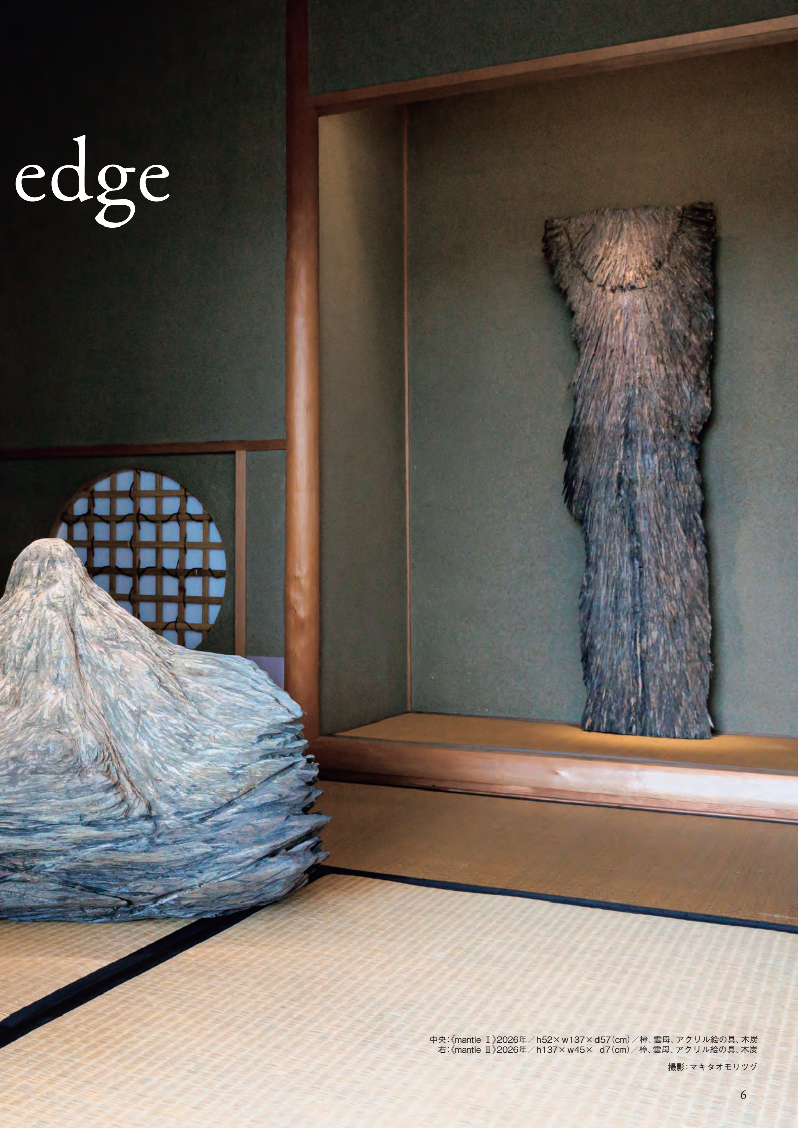
中央:〈mantle I〉2026年／h52×w137×d57(cm)／樟、雲母、アクリル絵の具、木炭 右:〈mantle II〉2026年／h137×w45×d7(cm)／樟、雲母、アクリル絵の具、木炭