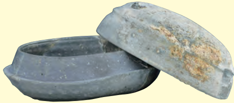
3 蓋杯 古墳時代(6世紀) 牛頭窯 福岡県大野城市牛頭本堂遺跡群出土 大野城市

須恵器の新技术である「ロクロ」の導入は、整った形の器を効率よく作ることを可能にし、規格的な器が生産されるようになりました。そのため、人々の生活様式や価値観の変化は、器の形にも敏感に表れるようになります。たとえば、6世紀に伝来した仏教文化は、関連什器として金属製の器をもたらしました。須恵器は7世紀になるとそのデザインを取り入れた器が作られるようになり(写真4)、古墳時代の器(写真3)から様変わりします。