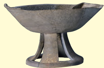
10 船形高杯 古墳時代(5世紀中葉) 陶邑窯 千葉県市原市草刈3号墳出土 千葉県教育委員会 ※本作品は、Episode1に出品