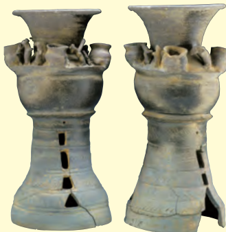
8 裝飾付台壺 古墳時代(6世紀) 岡山県瀬戸内市瀬波戸池古墳出土 岡山県立博物館

須恵器のなかには、「裝飾須恵器」あるいは「特殊須恵器」と呼ばれる、豊かな装飾をもつものがあります。これらは主に古墳時代後期から飛鳥時代にかけて作られ、墳墓での儀礼や祭祀に用いられました。たとえば、器台の上に同じ形の器(子器)をいくつも取り付けた「子持須恵器」(写真7)、人物や動物の小像を付けた「小像付須恵器」(写真8)、さらに鳥や亀などの動物をかたどった器(写真9)、船を表現した「形象須恵器」(写真10)と、様々な形が作られ、多様で独創的な造形を展開しました。