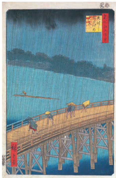
「名所江戸百景 大はしあたけの夕立」 安政4年(1857) 展示:11月17日(火)～12月20日(日)

山口県立萩美術館・浦上記念館は、開館30周年を迎えました。それを記念して、館蔵する浮世絵版画の中から、葛飾北斎と並び称される巨匠、歌川広重の名所風景画を3回にわたる展示でご紹介します。