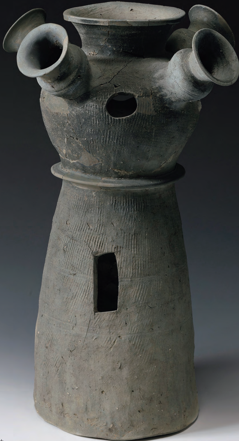
重要文化財 脚付子持壺形須恵器 古墳/飛鳥時代(7世紀) 鳥取県倉吉市上野遺跡出土 国(文化庁保管) 【展示:8月11日-9月23日】