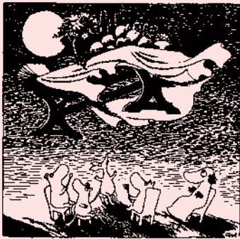
（たのしいムーミン一家）1948年 ©Moomin Characters™

「ごちそう」や「共生」などを意味する言葉「コンヴィヴィアル」をテーマとして、豊かな自然に寄り添いながら仲間とともに生きるムーミンの世界観を、原画や複製原画、フィギュアなども交えて紹介します。